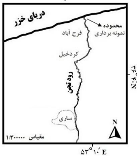
شکل ۱: موقعیت منطقه نمونه برداری

اندازه‌گیری پارامترهای غیرزیستی: اندازه‌گیری دمای آب توسط دماسنج معمولی، pH توسط pH متر پرتابل، شوری توسط شوری‌سنج پرتابل، اکسیژن محلول (DO) با استفاده از روش وینکلر، کدورت با استفاده از کدورت‌سنج AQUALYTIC، کل مواد معلق (TSS) توسط ترازو Sartorius مدل TE313S (با دقت ۰/۰۰۱ گرم) و فیلتر سلولزی استات ۰/۴۵ میکرومتر، هدایت الکتریکی (EC) و مواد جامد محلول (TDS) با استفاده از دستگاه TDS/Conductivity Meter مدل (WTW3110) و سختی کل (TH) با استفاده از روش کمپلکسومتری انجام شد (۱۹). پارامترهای ازت آمونیومی (NH 4 +N)،