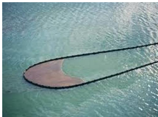
شکل ۲: نمونه بوم نفتی

می‌شود تا سوزانده شود. این سوختن درجا نفت می‌تواند به طور موثر تا ۹۸٪ نشت نفت را از بین ببرد، که راندمان آن بیش تر از سایر روش‌ها است. حداقل غلظت (ضخامت) سطح صاف نفت روی سطح آب برای هرگونه اثربخشی قابل اندازه‌گیری سوختن درجا ۳ میلی‌متر