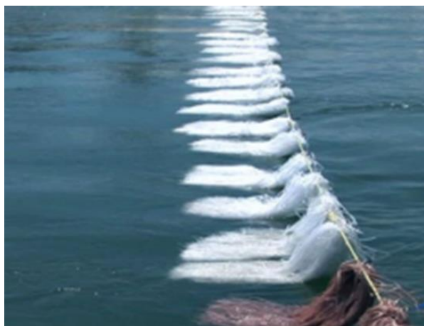
شکل ۳: الیاف شناور جاذب نفت (۴۱)

ریخته شده در دریا ایفا می‌کنند. اخیراً تعداد زیادی جاذب پیشرفته مختلف و دستگاه‌ها و فناوری‌های جمع‌آوری نفت مبتنی بر جاذب‌ها توسعه یافته‌اند. در خصوص استفاده از جاذب‌ها برای حذف نفت ریخته شده در دریا کارهای زیادی انجام شده است. در این زمینه مقاله مروری به چاپ رسیده که هدف از آن ارائه یک بررسی جامع از فناوری‌های پیشرفته ترکیب جاذب‌ها و دستگاه‌های جمع‌آوری نفت می‌باشد (۹). در این زمینه جنس و ظرفیت جاذب، طراحی دستگاه‌هایی که به همراه جاذب استفاده می‌شوند مانند جمع‌کننده‌ها مهم بوده و باید در طراحی مورد بررسی قرار گیرد. نمونه‌ای از جاذب الیاف که به صورت شناور مورد استفاده قرار می‌گیرد در شکل ۳، نشان داده شده است (۴۱).