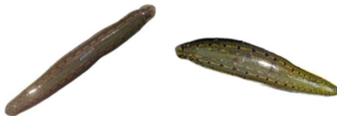
شکل ۳: زالوهای شرقی درمان شده Figure 3: Treated eastern leeches